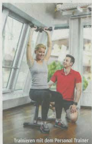
Trainieren mit dem Personal Trainer