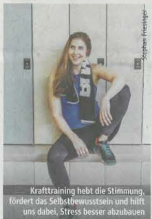
Krafttraining hebt die Stimmung, fördert das Selbstbewusstsein und hilft uns dabei, Stress besser abzubauen

Muskeln sind mehr als Kraftmaschinen und wichtige Fettverbrenner. Sie funktionieren zugleich als Stoffwechselorgan, als eine Schnittstelle zwischen dem Immunsystem und dem zentralen wie peripheren Nervensystem. Werden sie im Training richtig gefordert, produzieren sie eine lange Reihe an heilsamen Botenstoffen, die wie Medizin auf unseren Körper wirken. Sogenannte „Myokine“. Seit ihrer Entdeckung durch die dänische Wissenschaftlerin Bente Pedersen im Jahre 2007 wurden über 400 dieser Stoffe mit den unterschiedlichsten Wirkungsweisen ausgemacht. Pedersen selbst entdeckte als erstes Myokin „Interleukin 6“. Dieses Heilmittel aus unserem eigenen Körper ist mittlerweile gut erforscht: Man weiß, dass es das Fett schmelzen lässt, das Immunsystem stärkt und gegen Entzündungen wirkt. Darüber hinaus befördert es wie Insulin Zucker in unsere Muskeln, mit dieser Fähigkeit schützt es uns nicht nur vor Diabetes Typ 2, sondern vermag diese Erkrankung sogar zu heilen. Bis heute sind noch lange nicht alle Myokine endgültig erforscht, doch fest steht bereits: Regelmäßig benutzte Muskeln kurbeln die Selbstheilungskräfte des Körpers an. Und umso intensiver das Training gestaltet wird, umso höher gestaltet sich die Myokin-Produktion.