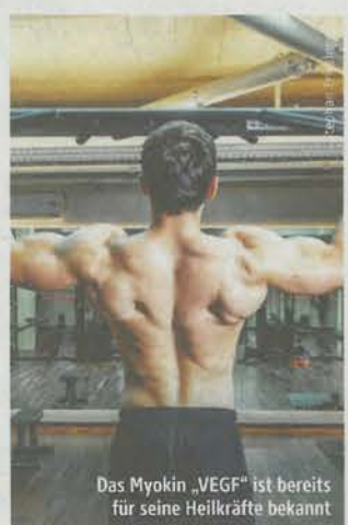
Das Myokin „VEGF“ ist bereits für seine Heilkräfte bekannt