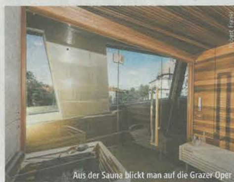
Aus der Sauna blickt man auf die Grazer Oper