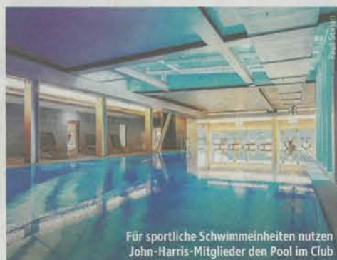
Für sportliche Schwimmereinheiten nutzen John-Harris-Mitglieder den Pool im Club