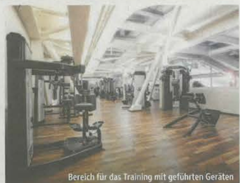
Bereich für das Training mit geführten Geräten