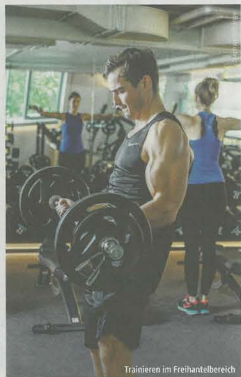
Trainieren im Freihantelbereich